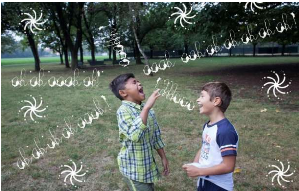
Foto tratte da Manuale BIC (ANTI-BULLYING PROGRAM), BIC - Bullying in Institutional Care, progetto Daphne JUST/2014/RDAP/AG/BULL/7625 Funded by the European Commission), Amici de Bambini- Fonte: Piattaforma Elisa